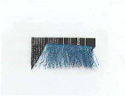
藤岡祐機《題名なし》2006-08年