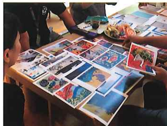
地元民間事業者とコラボし、障害者アートを活かした商品開発プロジェクトを企画中。

障害者アートの作品は、福祉施設による商品化や企業や団体とのコラボレーションなど様々な可能性を広げています。障害のある人と社会を、アートやデザインを媒介して結びつけるような優れた事例を紹介します。